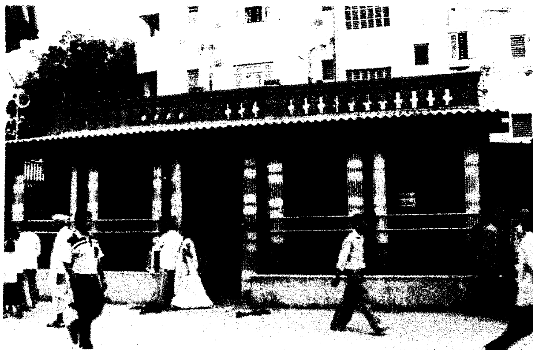
Shri Sai Baba's Chawadi