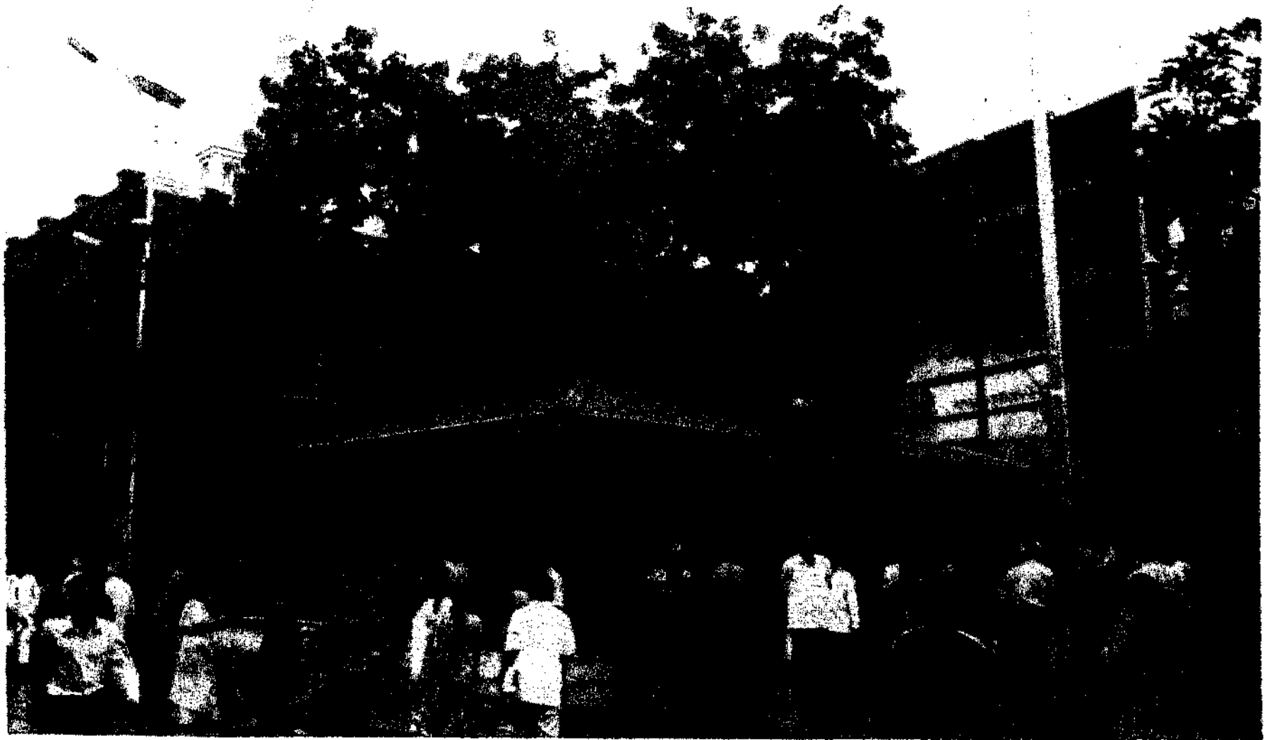
Shri Sai Baba's Gurusthan